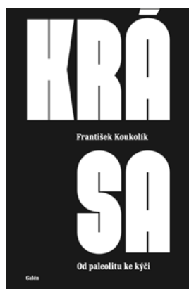
Galén, 125 × 190, 179 stran, brožované, 300 Kč