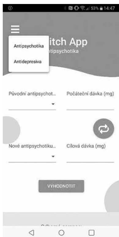
Obr. 1. Úvodní obrazovka aplikace, umožňující výběr mezi antipsychotiky a antidepresivy