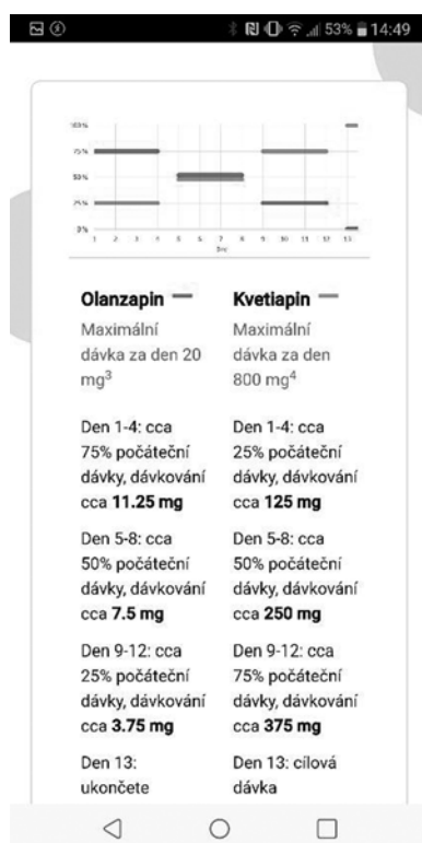
Obr. 2. Výstup pro antipsychotika – dávkovací graf a textový popis při změně dvou antipsychotik, olanzapinu a kvetiapinu