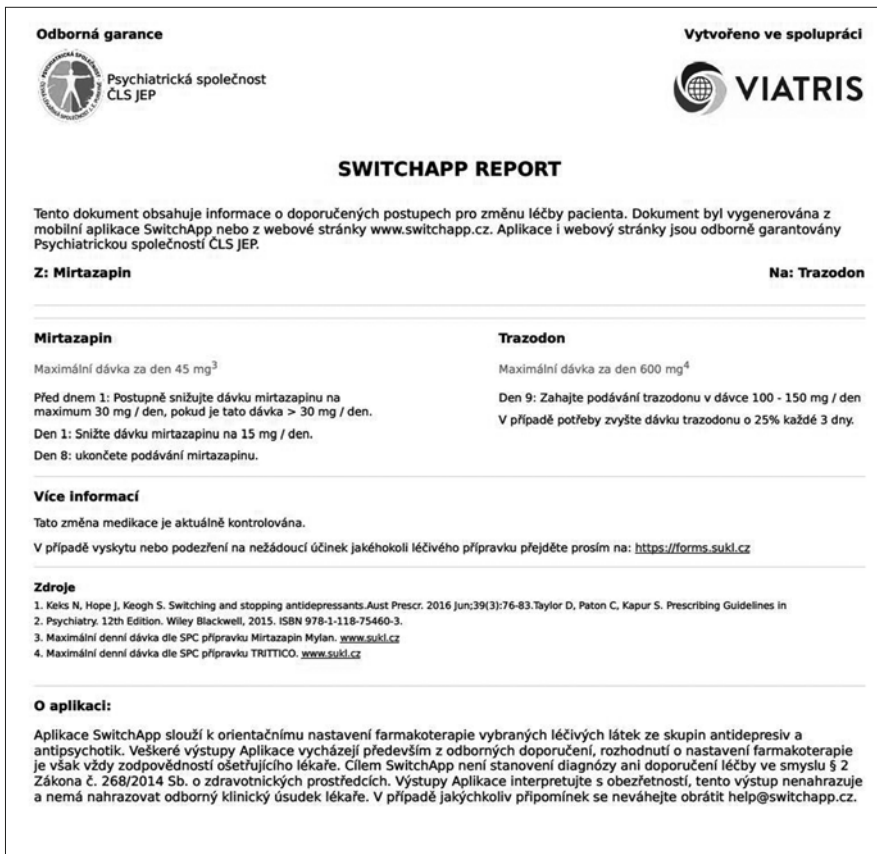
Obr. 4. Automaticky vygenerovaná zpráva z aplikace SwitchApp