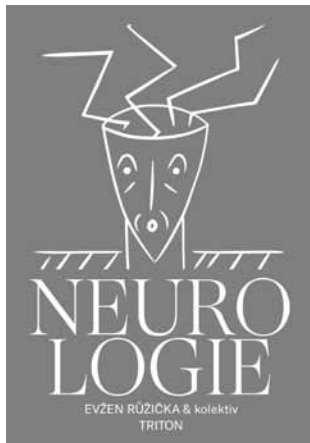
999 Kč, Triton, 2020, 155 × 220 mm, 531 stran, vázané