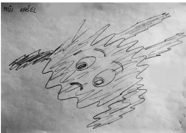
Obr. 2. Kresba „Můj kašel“

Do raného vývoje pacientky negativně zasáhla zmíněná předčasná separace od matky. Lze proto předpokládat nejistou vztahovou vazbu s ní a zpochybnění její role jako zdroje jistoty (viz také sen a „nejstarší zážitky“). Ego dítěte mělo proto potíže s integrací afektů,